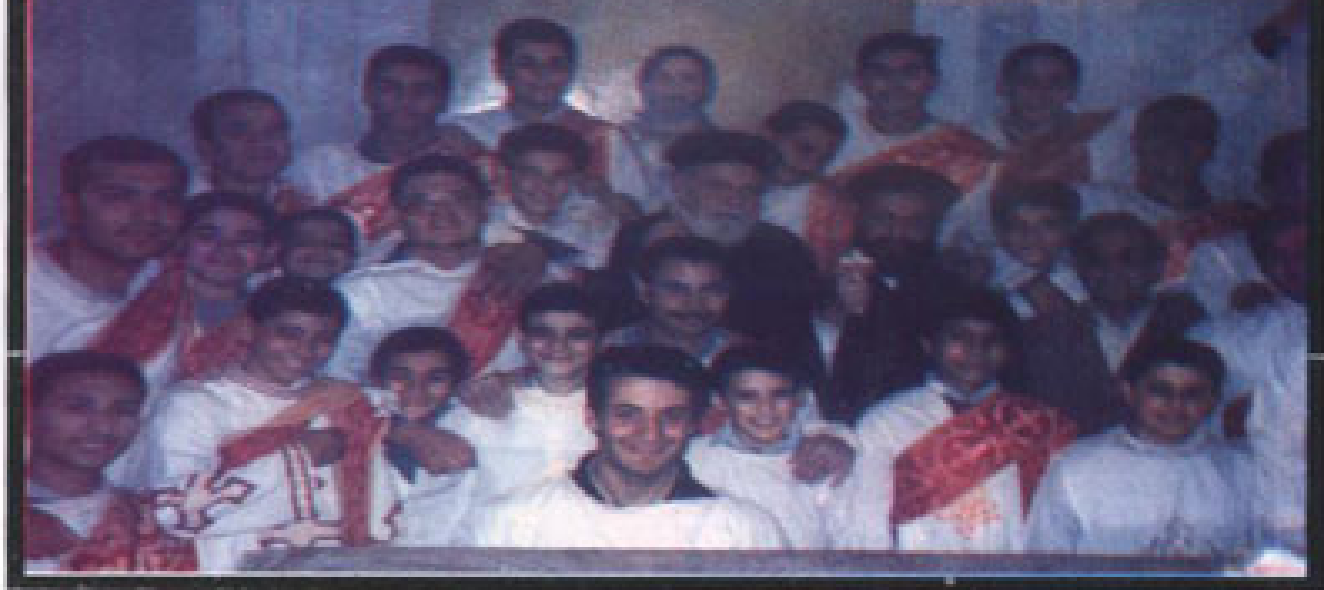
أحد خوارس الشمامسة