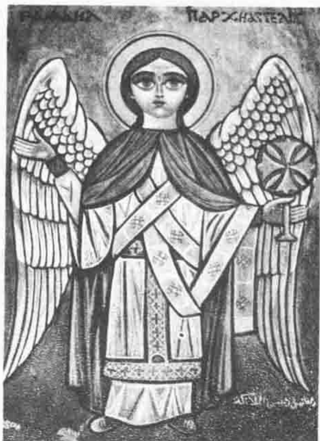
THE ANGEL RAFAEL. ΡΑΦΑΗΛ ΠΑΡΧΗΑΓΓΕΛΟΣ