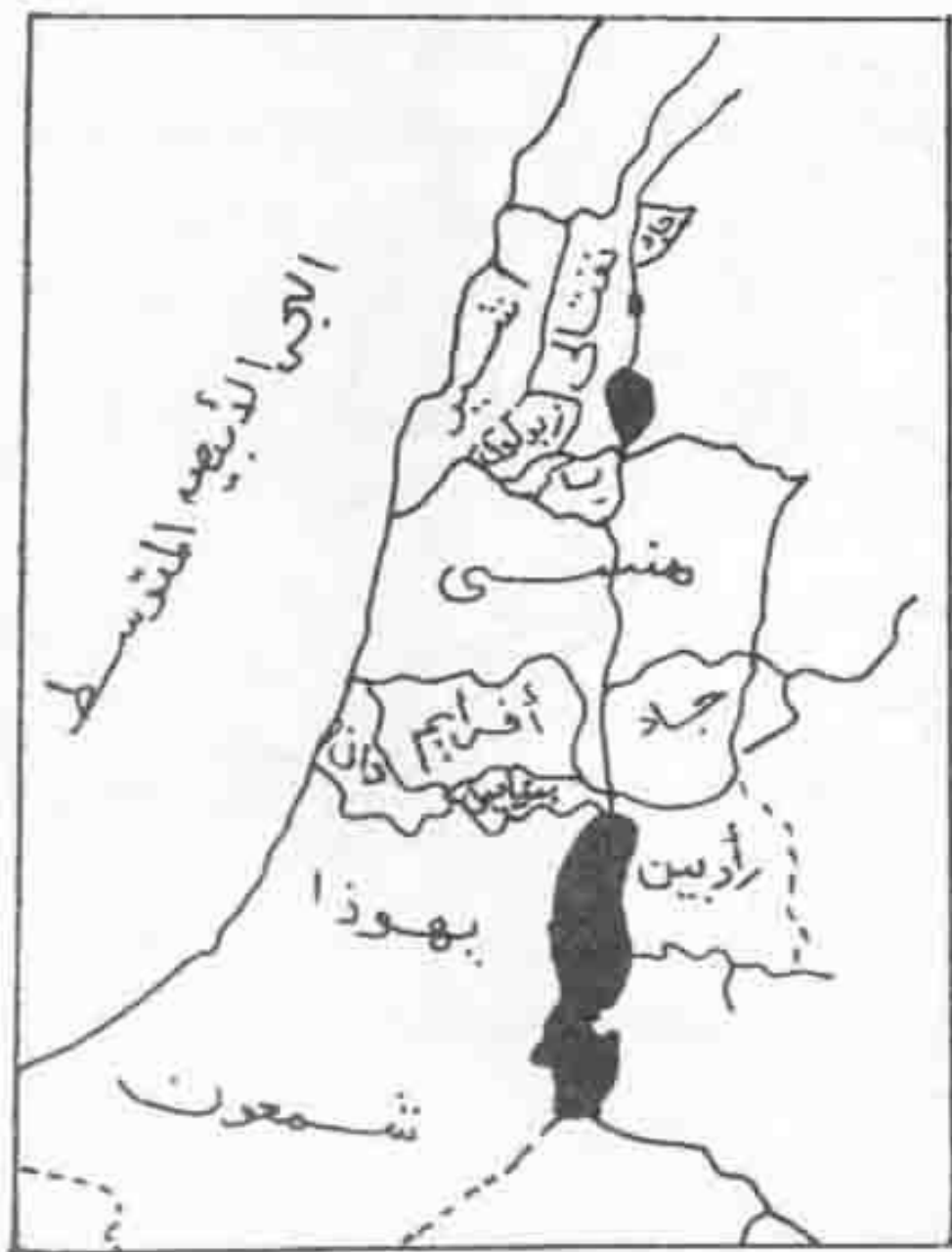
مناطق استيطان أسباط إسرائيل