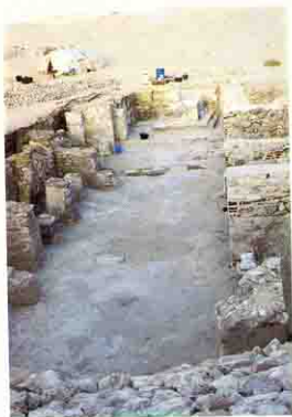
كنيسة أنبا يحنس للقصير

الأنبا صموئيل بعملية المسح الأثرى بالمنطقة حيث ظهر عشرات من المباني الرهبانية رسمها ثم عملت جسده داخل دير الأنبا يحنس ظهرت أرضيات المباني على عمق كبير ، ثم جاءت بعثة من متشيجان أكملت البحث وعشرت هذه السنة على كنيسة كاملة بمذبحها وحولها بعض المباني الرهبانية ، كما أكملت البحث خارج الدير الذي عثرت فيه على مبنى رهباني كامل .