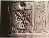
معبد فيله . اسوان Philea, Aswan

ولا ننسى ما اكتشف من آثار رائعة تحت البياض بكنيسة المعلقه بمصر القديمه بالهياكل القبلية كذا الممر الموصل للبحر لتكملة القداس أيام الاضطهاد بالمعادى والرسومات الجداريه بكنيسة أبو سيفين كذا ما ظهر اثناء ترميم كنيسة مارمينا بقم الخليج وغيرها .