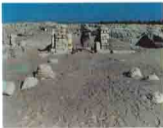
مدينة ماضي - الفيوم Medinet Madi, Fayum