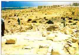
كنيسة بمدينة مارينا السياحية بجوار العلمين