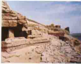
دير مارجرس . قبة الهواء St. George, Aswan

حيث يوجد أسفلها مقابر النبلاء التي استغل الاقباط اجزاء منها لاستعماله كدير به بعض الكتابات القبطية بإسم جورجيس ويجوارها بعض الأطلال لكنيسة ومباني ملحقة نشر عنها دكتور جروسمان فى دائرة المعارف القبطية .