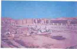
الكنيسة الكبيرة بأبو مينا Great Basilica: Abu Mina