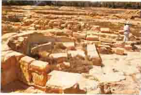
لكنيسة قرب سيدى محمود ببرج العرب

عثرت بعثة مصحلة الآثار على هذه الكنيسة وملحقاتها بجوار مقام سيدى محمود فى الجزء البحرى من مدينة برج العرب حيث وجدت آثار لكنيسة جميلة لها حنيتان فى الشرق وفى الغرب كما يوجد بالكنيسة من الجهة الغربية سلمان لمزار قديس .