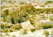
زخارف على شكل صليب بكاتبة اللومسة

في الطريق إلى دير سانت كاترين توجد واحة فيران التي تبعد ٦٥ كيلو من الدير وبها دير البنات الذي يتبع دير سانت كاترين . بالجبل المجاور عثرت بعثة المعهد الألماني للآثار عن آثار لبعض الكنائس والمباني الباقية من مدينة فيران التي كانت أسقفية يوماً ما .