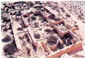
آثار الكنيسه بمعبد تابوزيرس

وعلى مسافه ١ كم تقريبا على الطريق الواصل الى مدينة برج العرب بجوار ابراج الكهرباء الضغط العالى وجدت اثار لكنيسه بجوار اثار حصن مجاور اكتشفها د. جروسمان من المعهد الالمانى للآثار.