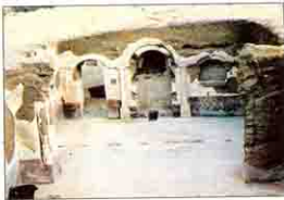
مسالة كبيرة للاجتماعات والصلاة Kellia