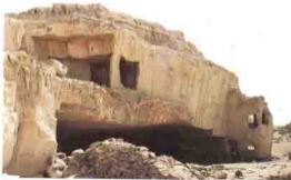
145 Dair Al-Dik, Antinoe