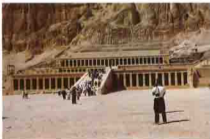
Dair Al Bahari