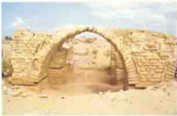
آثار سداهريج المياه بالفلوسيات