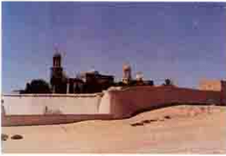
منظر عام لدير السريان

وفى دير الانبا بيشوى أثناء ترميم حوائط كنيسة الانبا بنيامين ظهرت بعض الرسومات الحائطية القديمه لبعض القديسين . وفى الجزء القبلى من الدير على مسافة كيلو متر ظهر فى الأكوام الأثرية آثار لكنيسة صغيرة ترجع للقرن السابع الميلادى .