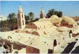
دير الانبا بيشوى Dair anba Bishoi