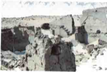
136 Dair Apollo, Bawit

وفى منطقة منقباد أتمت كلية الآداب بجامعة سوهاج الكشف عن الكثير من الآثار الرومانية ويجوارها ثلاث كنائس قبطية حولها بعض المباني .