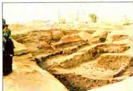
مبانى الأثرية بجوار دير الست نعمة بديرارى بقلاس Dimiana

أثناء ترميم حوائط الكنيسة القديمة بدير البرموس عثر أسفل البياض بمنطقة الصحن الأوسط وبالهيكل على رسومات تمثل حياة السيد المسيح كذا بعض القديسين وأهمها مناولة ملكى صادق لإبراهيم من المستير بدلاً من الكأس وترجع هذه الرسومات للقرن ١٣ / ١٤ م قام بترميم الرسومات ودراستها بعثة جامعة لايدن بهولندا .