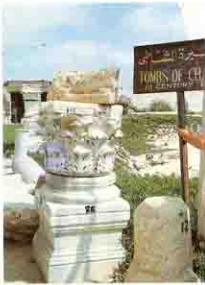
Shatby آثار الشاطبي

اثناء اجراء الحفائر في منطقة كوم الدكة وجدت عناصر قبطية كثيرة بالموقع من تيجان وزخارف وإن لم يعثر حتى الآن على أى مباني متكاملة لكنيسة . وفى منطقة الشطبي وجدت آثار قبطية أخرى أخذت من أساسات بعض المباني بالمدينة وقد خصصت إحدى القاعات بالمتحف الرومانى بكثير من الآثار القبطية التى وجدت بالدخيله من المحتمل أن تكون من آثار دير الزجاج المشهور غرب الاسكندرية.