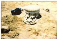
تاج بالفرما Farama.