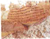
جبل الطير . الخارجة 13 Gabal Al-Teir Inscriptions

فى منطقة شمس الدين التى تبعد ٥ كيلو متر شمال واحة باريس جنوب الواحات الخارجة بحوالى ٩٥ كيلو اكتشف المعهد الفرنسى للآثار الشرقية بالقاهرة واحدة من أقدم كنائس مصر التى ترجع للقرن الرابع الميلادى وتؤكد ذلك من العملات التى وجدت فيها .