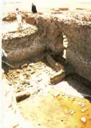
كنيسة ومزار بالفرما