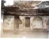
٧٢ دير أبو فام - البرشا