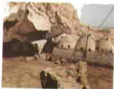
Dair Al Ganadla