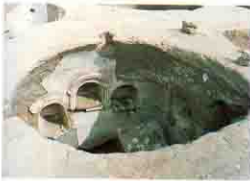
Kellia حجرة بها حنيات بكليا