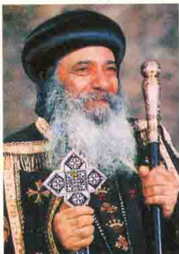
قداسة البابا المعظم الأنبا شنودة الثالث