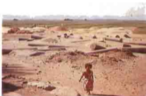
بازيليكا أنبا باخوميوس - فاو قبنى Bukhômios Basilica, Faw

القديس غالبا ما ترجع ٦/٥ م . وفي منطقة السبع جبال خلف دير الملك بأخميم تم الوصول إلى منطقة دير بدير العين وتقع آثاره أعلى الجبل من الصعب الوصول إليها . وفي منطقة دير الشهدا بأخميم تم العثور على أجزاء سليمة لبعض الشهداء بجوار الدير وهو المشهور بالنسيج القبطى القديم الموجود فى معظم متاحف العالم .