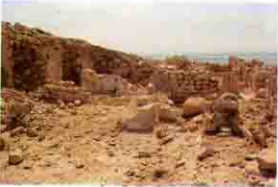
كنيسة ماخورا قرب مريوط Mahura

وجدت هذه الكنيسة غرب برج العرب وتتكون من خمسة أجنحة وإمبل يقع فى الجزء البحرى من مدخل الهيكل الرئيسى . عثرت عليها بعثة المعهد الألمانى للآثار بالقاهرة وبالكنيسة مغطسين فى الجزء الشرقى من الكنيسة قرب الهياكل .