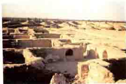
مباني دير الارمن Dair al - Arman