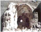
دير مصطفى كاشف - الخارجة Dair Mústafa Kasher