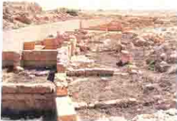
حجرات المرضى حول مدفن أبو مينا