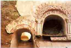
Kellia حنية مزخرفة بكليا