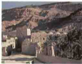
دير الانبا انطونيوس