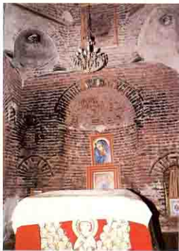
الكنيسة الأثرية بدير الست دميانه بالبراري