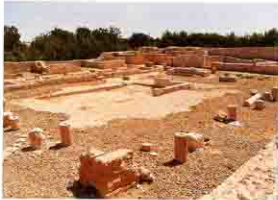
فناء القفلا بالهوارية Hawaryah

تقع آثار الهواريه وهى بقايا مدينة ماريا ٤ كم شرق بهيج على الطريق الرئيسى إلى برج العرب وقد كشفت بعثة كلية الآداب بجامعة الاسكندرية عن قفيلتين رومانيتين عبارة عن فناء مكشوف حوله الحجرات وبين القفيلتين توجد كنيسة صغيرة أرضيتها رخام مزخرف برسوم هندسية ويقرب بحيرة ماريا توجد حمامات رومانية ودكاكين كما اكتشفت هناك كنيسة رائعة رباعية الحنيات .