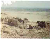
٦٨ دير سباط . انصنا