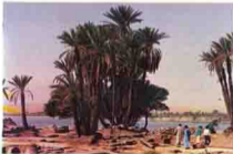
آثار نجع الحجر . اسوان Nag Al Hagar, Aswan

تقع نجع الحجر ١٧ كيلو شمال أسوان حيث عثرت بعثة مصلحة الآثار على معسكر روماني وبعض الآثار المسيحية والأعمدة الجرانيتية .