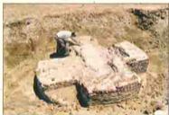
بقايا عمودية قديمة - الفرما - على شكل صليب Farama