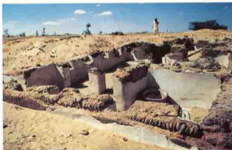
دير نهيا بالنصورية - Dair Nahya