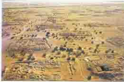
Kellia منظر عام للمشويات كليا

اشترك في هذه الحفائر المعهد الفرنسي للآثار الشرقية سنة ١٩٦٤ للعمل في قصور الروبايعيات ومن سنة ١٩٧٧ إنضمت جامعة جنيف للعمل في منطقة قصور عزيله وعريمه ومن سنة ١٩٨٦ إنضمت بعثة مصلحة الآثار لحفائر قصور الروبايعيات ويحوى الموقع على حوالي ٢٥٠٠ موقع أثرى للمباني الرهبانية من القرن الرابع حتى القرن الثامن م وقد تفضل قداسة البابا شنودة بزيارة الموقع سنة ١٩٦٨ حيث تابع أعمال الحفائر واستفاد العاملون بالموقع بتصاصحه وخبراته عن الحياة الرهبانية .