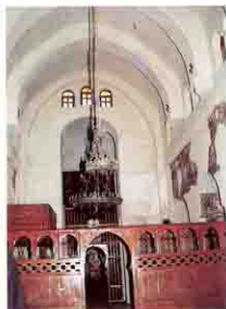
صحن الكنيسة الأثرية بدير البرموس

أثناء ترميم الحنية الغربية بكنيسة العذراء بدير السريان ظهر أسفلها صورة رائعة للبشارة تمثل الملك غبريال يبشر السيدة العذراء وعلى جانبيهما أربعة من أنبياء العهد القديم يحملون نبواتهم عن التجسد وحالياً يجرى فحص جميع حوائط الكنيسة التى ظهر فيها كثير من الصور الرائعة منها واحدة للسيدة العذراء ترضع السيد المسيح كما ظهرت صورة رائعة للبطاركة الكبار ابراهيم واسحق ويعقوب يحملون فى أحضانهم أرواح القديسين . وحول الدير ظهرت اثار لكثير من المباني الرهبانية تعيد بناء إحداها وتعد حالياً لتكون متحفاً للحياة الرهبانية القديمه .