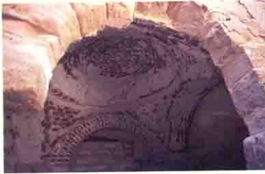
Tomb of Abu Mina, Maryut

مدخل دير مارمينا الحديثه وجدت البازليكا البحريه وغالباً كانت لأسقف المنطقه وخدامها من الرهبان أو الكنيسه الشرقيه وهى على شكل صليب وجدت جنوب شرق قرار البابا كيرلس السادس وعلى مسافه ٢ كم منه .