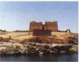
معبد كلاشه . اسوان Kalabsha, Aswan