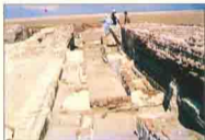
مخازن لطفان أسفل الهياكل بكتيبة بالفرما