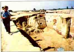
آثار مهتمة من منطقة القلاوي Kellia