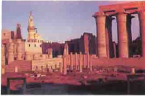
كنائس حول معبد الأقصر