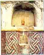
حنية للصلاة بمنطقة القلاوي

وبعد الزحف العمراني لزراعة هذه المنطقة بدأ تساقط معظم المباني بعد نقل أهم الآثار والرسومات الجدارية الى مخازن الآثار وبدأت هذه المنطقة في الإندثار.