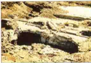
آثار صهاريج لتخزين المياه أثناء الفيضان بجيزة ناهيا بدير ناهيا بورسعيد Tennis

بالقرب من قصر حافظ عفيفي بالمنصورية بجوار كرداسه وناهيا عثرت بعثة مصلحة الآثار على إحدى المنشوييات ( المبانى الرهبانية ) التى تحوى كثير من صور القديسين مثل الأنبا أمونيوس وبامون وبموسيس وأبا هور وقزمان ودميان وألكسندروس وقرياقوس ويوليتا وميخائيل وسوريال التى غالباً ما ترجع للقرن ٦ م وهى غالباً من بقايا دير ناهيا المشهور .