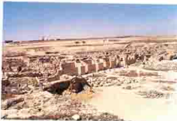
آثار مدينة أبو مينا

استكملت بقية الآثار الألامنية اعمالها بمدينة أبو مينا الأثرية حيث اكتشفت خلال الخمسة والعشرين سنة الأخيرة جميع معالم مجمع الكنائس ( البازليكا الكبيرة ، كنيسة المدفن والمعمودية ) وآثار أساسات كنائس أقدم ترجع للقرن الخامس الميلادي وتختلف فى تصميمها عن الكنائس التى ترى حالياً كذا تم الكشف عن ساحة استقبال الزوار بحرى مجمع الكنائس وحولها بعض الدكاكين لهدايا الحجاج كذا يتوسطها اعمدة تذكارية غالباً ما كانت تحمل نصب تذكاري وفى الركن البحرى الغربى منها يوجد مكان الفندقين لراحة الحجاج ويسبقها منطقة الحمامات التى يحتاجها الزوار القادمين من مناطق بعيدة . كذا تم الكشف عن المنطقة قبلى الكنيسة وتحوى بعض المقابر وحجرات المرضى على شكل نصف دائرى تطل على الفناء بين الكنيسة والحجرات . وعثر على أجزاء كثيره من السور الذى يحيط بالمنطقة كلها والبوابة الرئيسية فى الجهة البحرية (قرب دير مارمينا الحديث الحالى ) . ويتوسطها باب كبير للعربات وعلى جانبه بابين صغيرين للمشاة وفى الجزء الغربى من مجمع الكنائس وعلى مسافة ٢كم وجدت منشويبه كبيره فى الجانب القبلى منها وجدت كنيسه بطول المنشويبه وبحرى مجمع الكنائس قرب