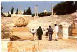
Kom al - Dikka آثار كوم الدكة