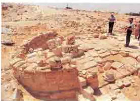
Church at Marina - Alamen