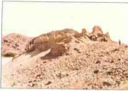
بقايا مدينة فيران بجنوب سيناء . Firan

على مسافة ٥ كيلو شمال شرق مدينة الطور عاصمة جنوب سيناء عثرت مصلحة الآثار على كنيسة تتوسط حجرات الرهبان والكنيسة والحجرات على طراز الشام حيث كانت سيناء تتبع أسقفية القدس في الأزمنة الماضية .