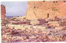
Taposiris الكنيسه فى أبو صير برج العرب

على طريق مرسى مطروح عند برج العرب يوجد على قبلى الطريق اثار معبد بطلمي لعباده الإله اوزوريس اطلق عليه تابوزيرس ماجنا وبجوار الحوائط الشرقيه والقبليه والغريبه حجات كبيرة يظن انها كانت للحاميه الروميه التى كانت تسكن المبني ويتوسط الحجات كنيسه صغيره مشابهه فى تصميمها لحاميه أخرى بسوريا .