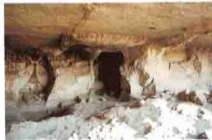
٧١ دير البرشا - ملوى