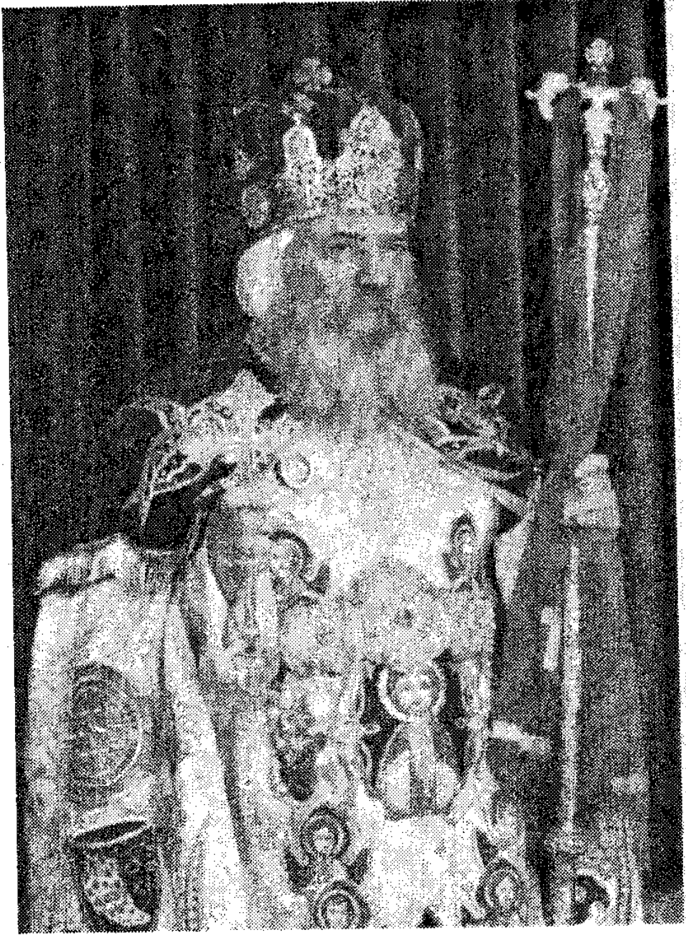
قداسة البابا شنودة الثالث بابا الإسكندرية وبطريك الكرازة المرقسية