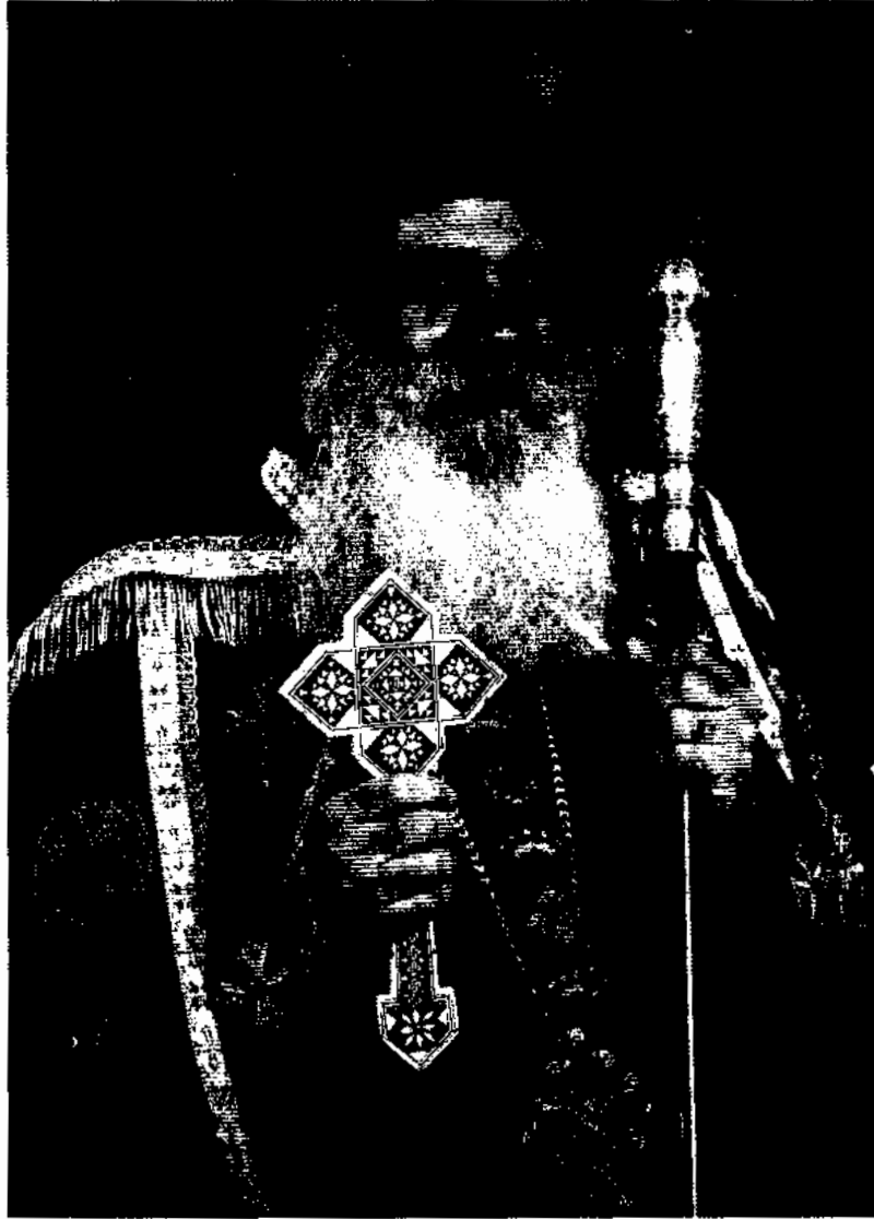
صاحب الغبطة والقداسة البابا المعظم الأبنا شنودة الثالث بابا الإسكندرية وبطريك الكرازة المرقسية