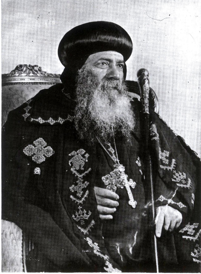
مثلت الطوبى قداسة البابا شنوده الثالث بابا الكسندرية وبطريك الكرازة المرقسية ال ١١٧