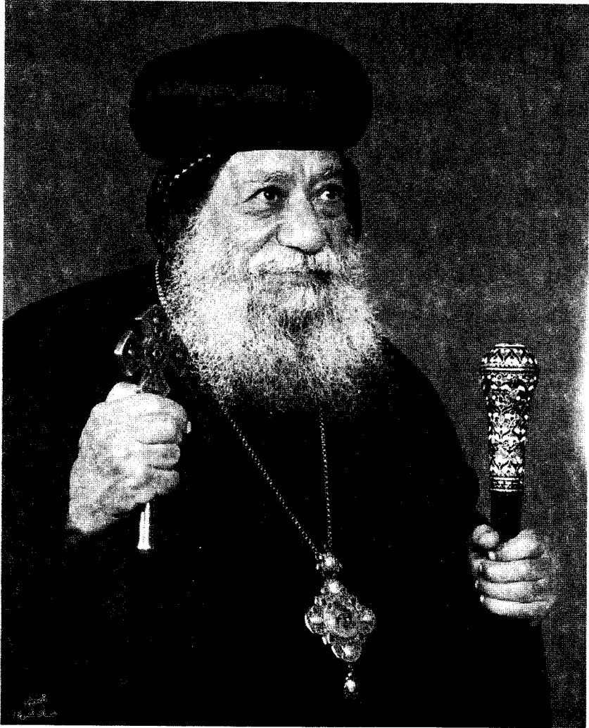
نيافة الحبر الجليل المتنيح الأنبا غريغوريوس