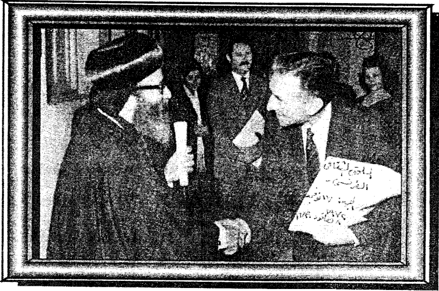
مع الملحق الثقافي الفرنسي بمعهد الدراسات القبطية في ١٧ نوفمبر ١٩٧٢