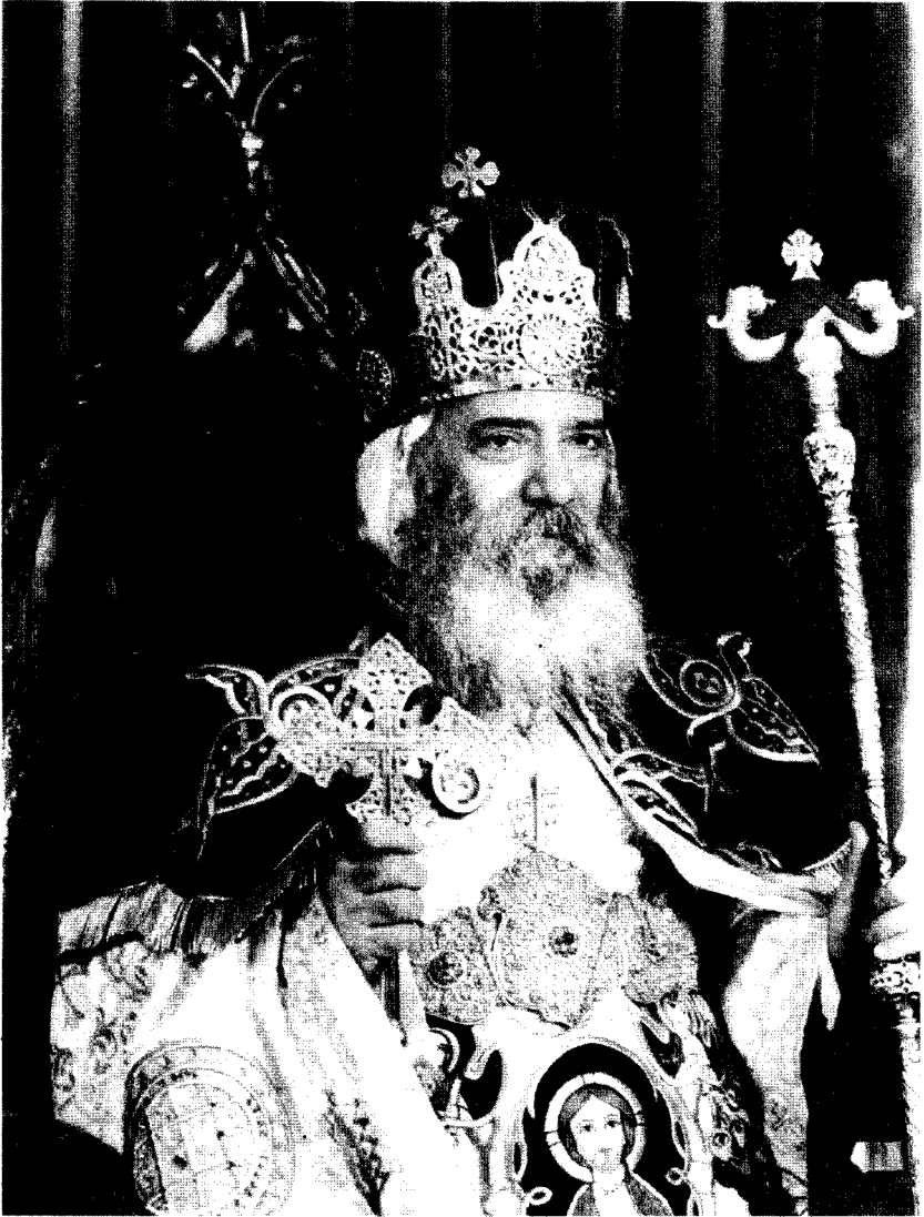
قداسة البابا المعظم مثلث الرحمات الأنبا شنودة الثالث