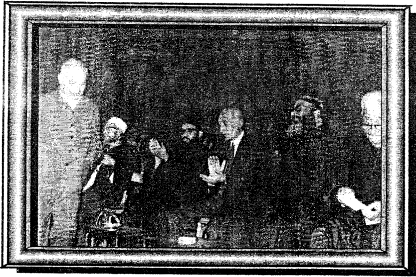
في إجتماع اللجنة العامة للجان المواطنين من أجل المعركة (القاعة المرقسية الكبرى مساء الأربعاء ٢٠ مايو ١٩٧٠ - ١٢ بشنس ١٦٩٦)