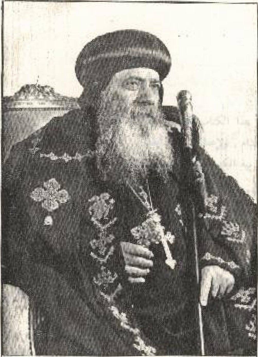
قداسة البابا شنودة الثالث