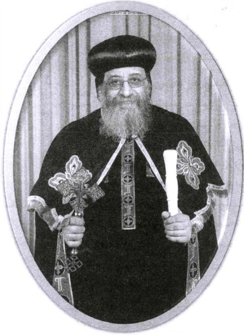
قداسة البابا المعظم الأنبا تواضروس الثاني (١١٨)