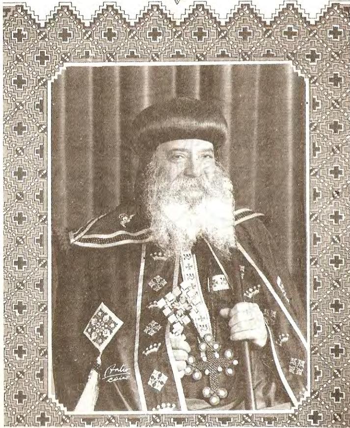
قداسة البابا شنودة الثالث بابا الإسكندرية وبطريك الكرازة المرقسية