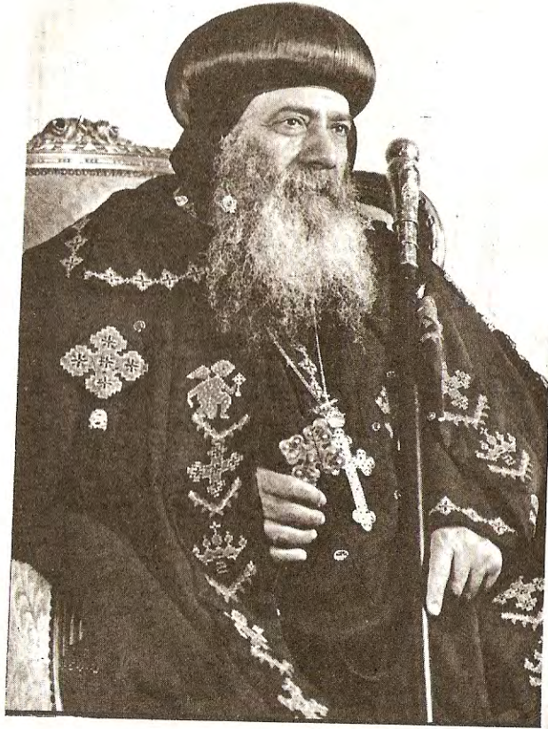
قداسة البابا شنودة الثالث بابا الإسكندرية وبطريك الكرازة المرقسية

الكتاب : القديس هيلارى ترجمة وإعداد : أنطون فهمى جورج . الناشر : كنيسة مارمرقس والبابا بطرس - الاسكندرية . جمع تصويرى : كوين سنتر - الأزاريطة - الاسكندرية . الطبعة : الاولى - ١٩٩٢ . المطبعة : الأنبا رويس (الافست) - العباسية - القاهرة . رقم الايداع : ٩٢/٥٢٩٨