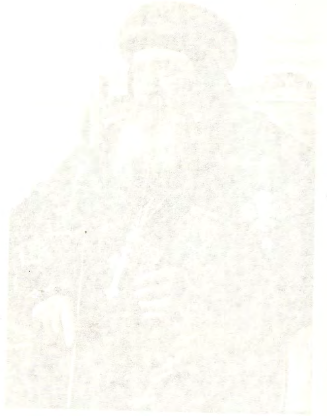
شالوا كنيسة القديس كيرلس

لقد سألت عروس النشيد حبيبها قائلة : «اخبرنى يا من تحبه نفسى ، اين ترعى ، اين تريض عند الظهيرة» ، فكان جوابه «إن لم تعرفى ايتها الجميلة بين النساء فأخرجى على آثار الغنم» {نش ١ : ٧} .... وليست آثار الغنم سوى اثار هؤلاء الالباء القديسين الذين أحبوا الرب وخدموه بكل طاقاتهم ، فصارت أخبارهم شهية جداً ، وصورة تدبير الله معهم مرسومة أمامنا كالأدوية الكريمة لعيوننا الضعيفة ، يرسمون لنا الطريق لتمثل