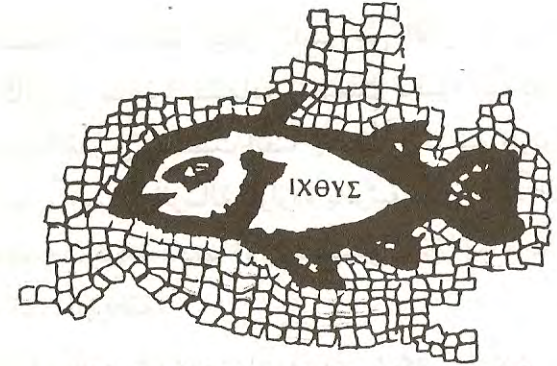
ΙΗΣΟΥΣ ΧΡΙΣΤΟΣ ΘΕΟΥ ΥΙΟΣ ΣΩΤΗΡ

الصلاة مصدر قوته ، وكيف انه رجل الكنيسة الواحدة في جوهرها وحياتها وايمانها في كل مكان ، الذي بقلب منفعل بالمحبة الالهية المكتملة بالاتحاد مع كل جسد المسيح ، تطلع الى الرب الذي حل فيه بالحقيقة بكيفية تفوق كل تعبير ، وصار له جوهرة فائقة لا يمكن ان يعادلها شيء ما في الوجود ، وكل شيء نفاية بالمقابلة معه ، فصار هو ذبيحة على مذبح الرب محرقة وقرباناً .