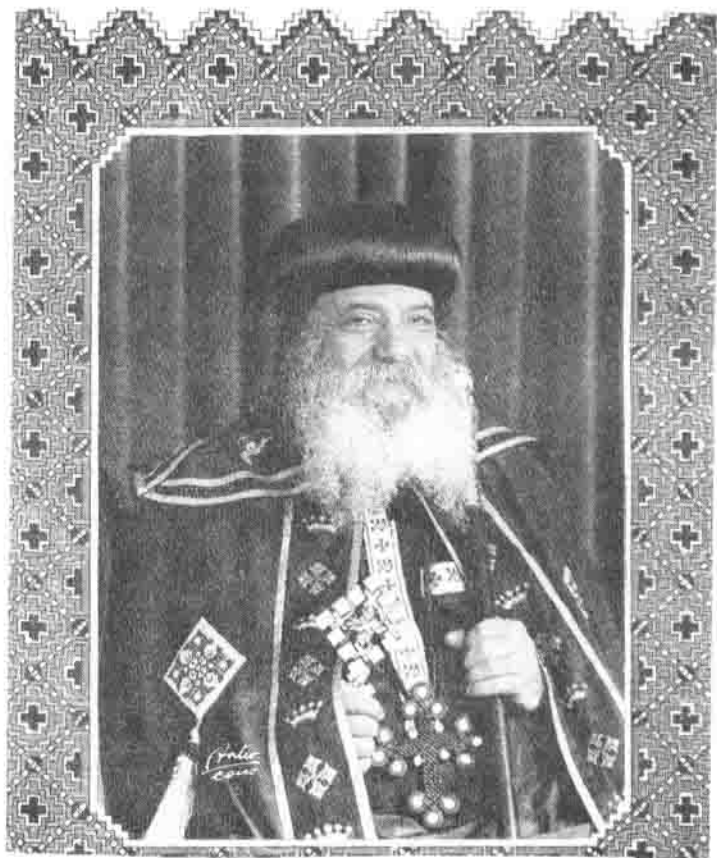
عمارة صاحب القديسة والغيظ الابا شنودة الثالث