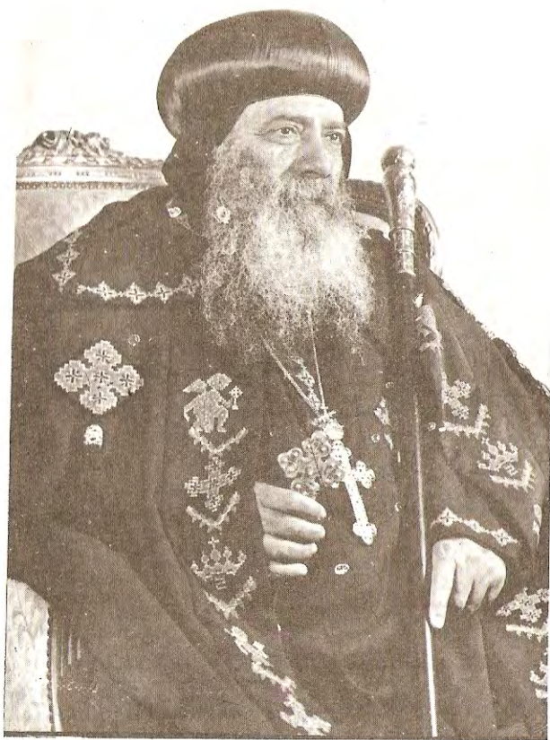
قداسة البابا شنودة الثالث بابا الإسكندرية وبطريك الكرازة المرقسية