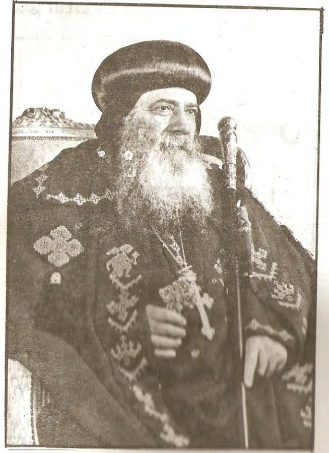
البابا شنودة الثالث

ونجد من الآباء من هو أديب ومن هو شاعر ومن هو كاتب ومن هو فنان ومن هو خطيب ومن هو فيلسوف (محب للحكمة) ، وإذا نظرنا الى الفرق بين فلسفة الآباء وبين فلسفة فلاسفة هذا العالم ، نرى الآباء يعلنون الحقيقة الالهية غير الكاذبة ، أما الفلاسفة فليس عندهم حق حقيقي ، بل هم فقط