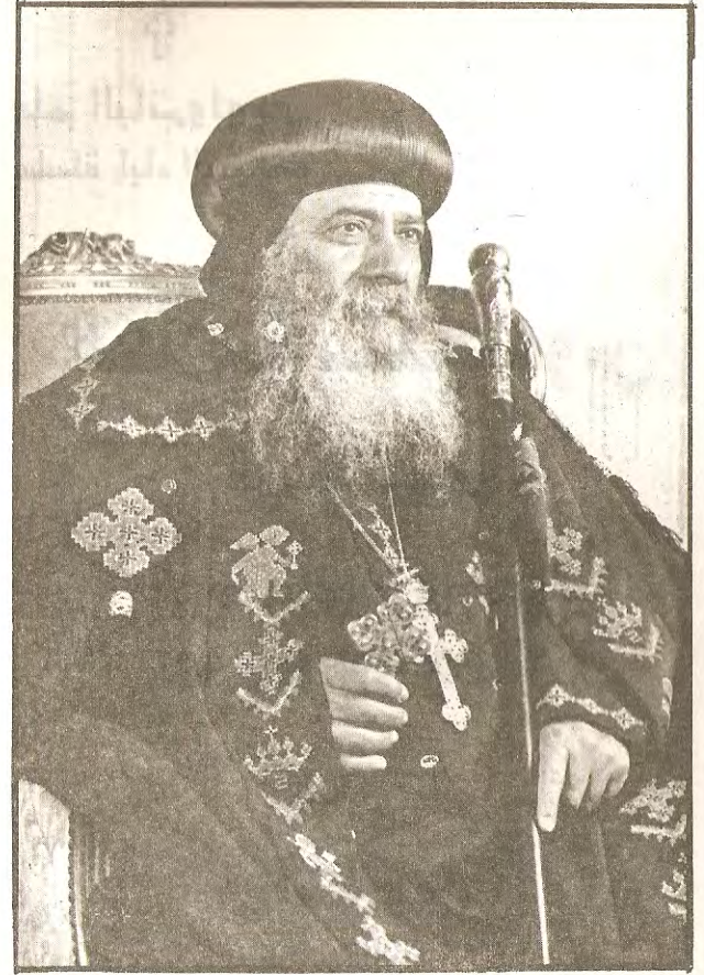
البابا شنودة الثالث

وبين يديك أيها الحبيب فى الرب ، سيرة العلامة السكندرى بنتينوس مدير مدرسة الاسكندرية اللاهوتية ، الفيلسوف