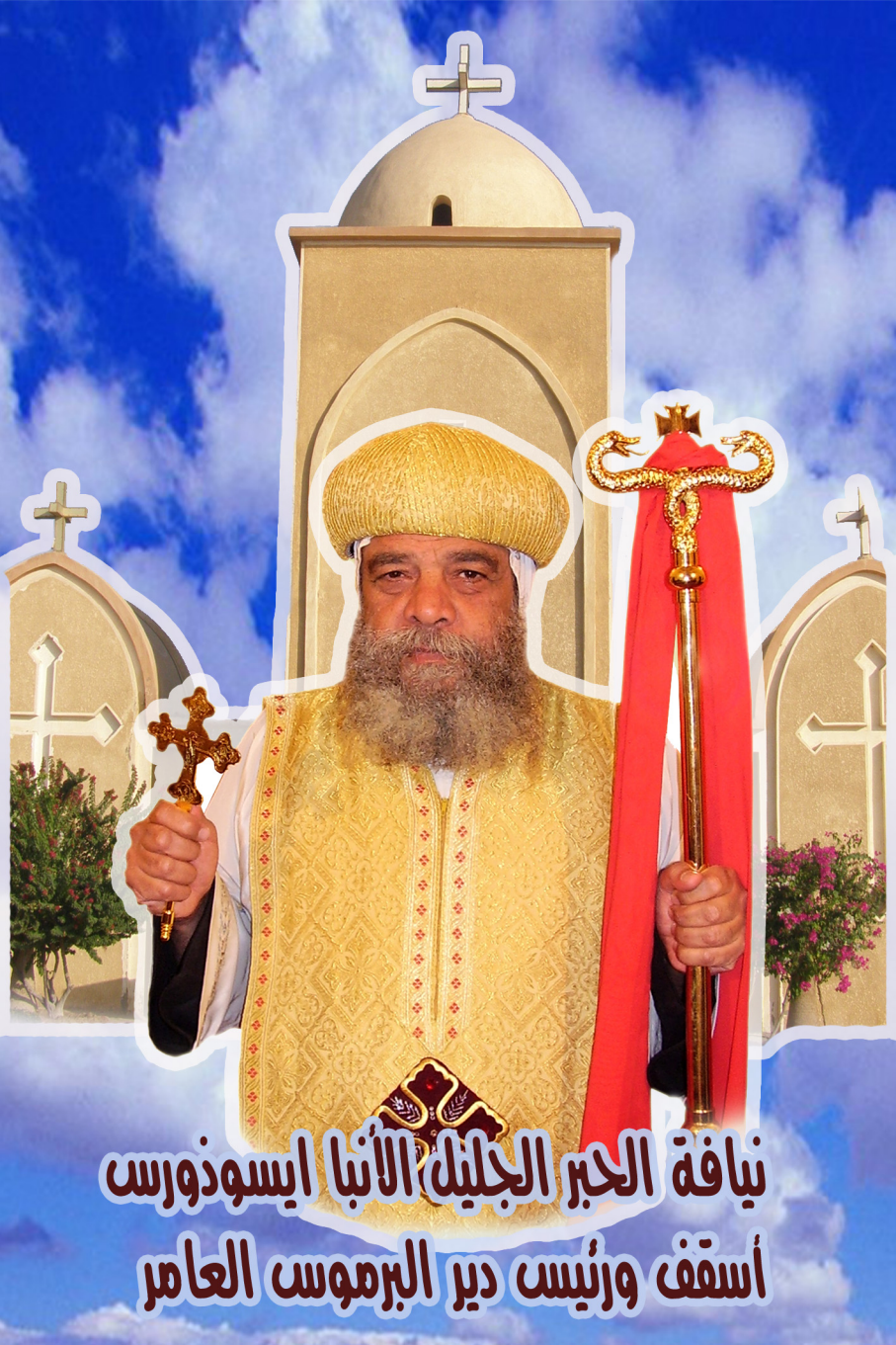
نيافة الحبر الجليل الأنبا ايسوذورس أسقف ورئيس دير البرموس العامر