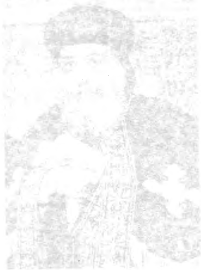
Major [Name], [Rank], [Regiment], [Location]